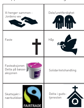
Klippekort for en rettferdig verden