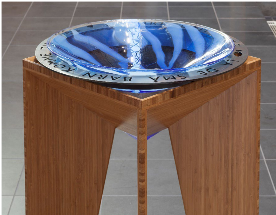
«Her e det et lite barn som kommer, [...] i ei kirke i en hellig dåp.» NoS 2013, nr. 592 Tekst og melodi: Kari Bremnes

Den mangfaldige og aukande interessa frå menneske som vil inn i kyrkjene, viser behovet for eit ope rom som kan famne livet, gi rom for undring og tilhøyrslø. Få andre stadar i dagens samfunn har slike rom. Både pilegrimar og andre som tilfeldigvis kjem framom, som bur i nærleiken eller har reist langt, bærer alle med seg dette ønsket: å få komme inn i den lokale kyrkja.