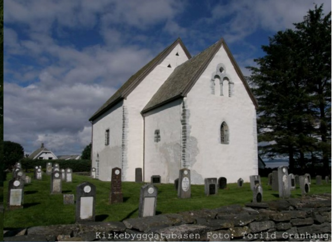
Kirkebyggedatabasen Foto: Torild Granhaug