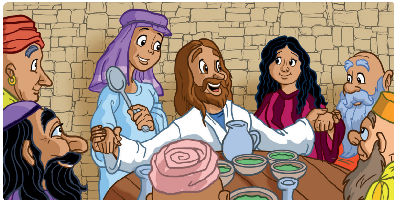
Teikning: TREVOR KEEN

Dei to bileta er nesten like. Finn du dei fem feila på biletet under?